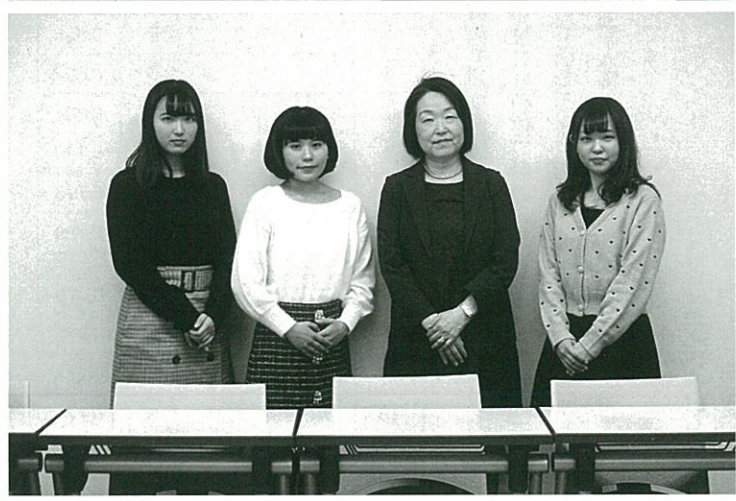
取材後、編集委員とともに